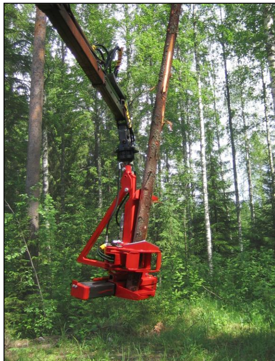
Puunkuljetus pystyasennossa helpottaa uralle tuomista ja säästää kasvavia taimia sekä jätettävää puustoa kolhuilta