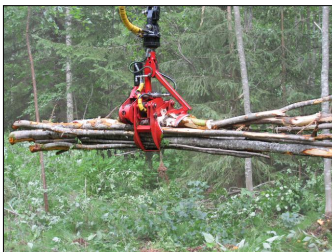
Kuormaus onnistuu normaalin kouran tapaan koko kouran täydeltä